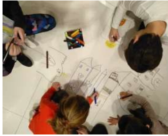
Εικόνα 5. Εργασία σε ομάδες -Σχεδίαση του χάρτη

Την επόμενη μέρα της επίσκεψης οι μαθητές και οι μαθήτριες αξιοποιούν στην τάξη τα φύλλα εργασίας και δραστηριοτήτων που έχουν αποσταλεί από το Μουσείο στον/στην εκπαιδευτικό και αναστοχάζονται πάνω στις δράσεις τους σε όλα τα στάδια του προγράμματος. Το υλικό αυτό αποτελεί σημαντικό εργαλείο της αξιολόγησης του εκπαιδευτικού, όπως και της αυτοαξιολόγησης των μαθητών/τριών στο πλαίσιο των Εργαστηρίων Δεξιότητων. Επιπλέον, συμπληρώνουν τυχόν καρτέλες παρατήρησης και σελίδες ημερολογίου, καταγράφουν τις σκέψεις και τις εμπειρίες τους, δημιουργούν άλμπουμ με ζωγραφιές και κολλάζ φωτογραφιών από την επίσκεψη ή εργάζονται σε ομάδες για τη δημιουργία του χάρτη της ξενάγησης στο Μουσείο. Στο πλαίσιο της ανατροφοδότησης και αξιολόγησης του εκπαιδευτικού προγράμματος από τους εκπαιδευτικούς και τους μαθητές, η σχολική ομάδα αποστέλλει στο Μουσείο φωτογραφίες ή κατασκευές από τις εργασίες τους και ο/η εκπαιδευτικός αποστέλλει συμπληρωμένο το φύλλο αξιολόγησης του προγράμματος.