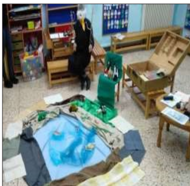
Εικόνα 2. Η μουσειοσκευή στην τάξη