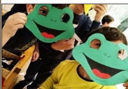
Εικόνα 3. Διάλογος με τα εκθέματα