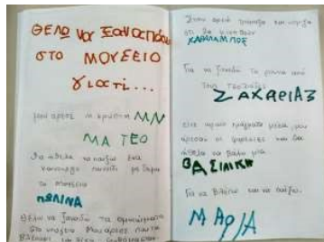
Εικόνα 6. Καταγραφή σκέψεων