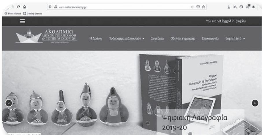
Εικόνα 1: Η ιστοσελίδα της Ακαδημίας Λαϊκού Πολιτισμού & Τοπικής Ιστορίας, http://learn.cultureacademy.gr , που υποστήριξε το εξ αποστάσεως τμήμα του προγράμματος.

Η Ακαδημία Λαϊκού Πολιτισμού & Τοπικής Ιστορίας, Τμήμα του Πολιτιστικού Φορέα «Μαγνήτων Κιβωτός, για τη Διάσωση του Πολιτιστικού Αποθέματος» της Ιεράς Μητρόπολης Δημητριάδος & Αλμυρού, το Χειμερινό εξάμηνο του 2019-2020 υλοποίησε το πρόγραμμα «Αρχαιακή Εθνογραφία σε Αρχαία Τοπική Ιστορία με τη χρήση ψηφιακών μέσων», στο πλαίσιο κύκλου σπουδών ενός εξαμήνου (Χειμερινό 2019-2020) για στελέχη πολιτισμού και εκπαίδευσης. Το πρόγραμμα υλοποιήθηκε με τη συνεργασία του Εργαστηρίου Λαογραφίας & Κοινωνικής Ανθρωπολογίας του Τμήματος Ιστορίας & Εθνολογίας της Σχολής Κλασικών & Ανθρωπιστικών Σπουδών του Δημοκρίτειου Πανεπιστημίου Θράκης και των Γ.Α.Κ. – Αρχαία Ν. Μαγνησίας.