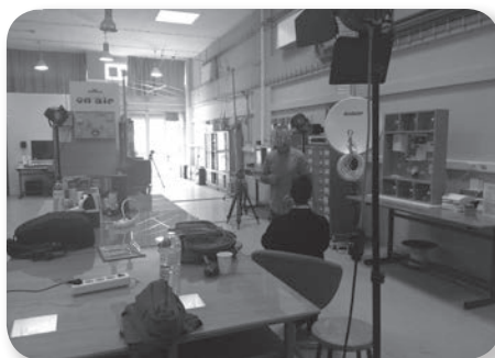
Εικόνες 4-5: Αριστερά, η εκμάθηση λογισμικών ψηφιακής αφήγησης και, δεξιά, το εργαστήριο καταγραφής προφορικής μαρτυρίας.

Η ανάπτυξη σχετικής μεθοδολογίας, αλλά και η υλοποίηση ενός τέτοιου προγράμματος, στηρίχθηκε στο πρόγραμμα «Αρχαιακή Εθνογραφία & Αναγνώσεις σε Ψηφιακό Περιβάλλον: “Συνομιλώντας” με τα αρχαία των Πηλιορείπων εν Αιγύπτω», που είχε πραγματοποιηθεί έναν χρόνο νωρίτερα από τον ίδιο φορέα, επίσης από ένα μεικτό πρόγραμμα (διά ζώσης και εξ αποστάσεως) (Βαρβούνης & Καπανιάρης, 2019; Karaniaris & Varvounis, 2019 a, b, c).