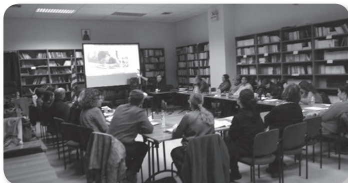
Εικόνα 9: Εργαστήριο σε επίπεδο ολομέλειας για τη σύνδεση της παρατήρησης με άλλα στοιχεία (πληροφορίες, βιώματα, μνήμες κ.λπ.).

Έπειτα, πραγματοποιήθηκε έρευνα στο διαδίκτυο για επιπλέον πληροφορίες και συζήτηση με τα μέλη της ομάδας. Η πρόσκληση ενός πληροφορητή στο εργαστήριο φώτισε κάποιες ιδιαίτερες πτυχές ανθρώπων που είχαν προσωπική, βιωματική σχέση με κάποια από τα αρχαιακά τεκμήρια και την εποχή τους.