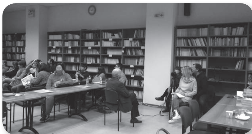
Εικόνα 6: Η διαδικασία καταγραφής της προφορικής μαρτυρίας (συνέντευξη) από αφηγητή, κατά τη διάρκεια εργαστηρίου.

Τα εργαστήρια των οπτικοακουστικών για τον σχεδιασμό ενός ντοκιμαντέρ, τα οποία πραγματοποιήθηκαν, ήταν: α) Εργαστήριο Οπτικοακουστικών I: Εργαλεία για την παραγωγή ενός ντοκιμαντέρ, διάρκειας πέντε ωρών, β) Εργαστήριο Οπτικοακουστικών II: Εργαλεία για την παραγωγή ενός ντοκιμαντέρ (Μοντάζ), διάρκειας πέντε ωρών, γ) Εργαστήριο III: Έρευνα αρχείων και σύλληψη της ιδέας ενός ντοκιμαντέρ, διάρκειας οκτώ ωρών, δ) Εργαστήριο IV: Το σκαρίφημα σεναρίου ενός ιστορικού ντοκιμαντέρ, διάρκειας οκτώ ωρών.