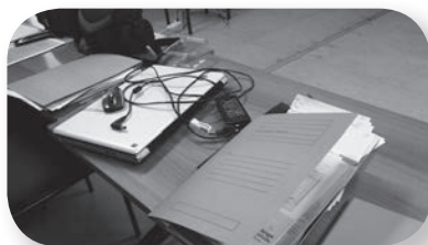
Εικόνες 7-8: Αντίγραφα αρχαιακών τεκμηρίων (αριστερά) και εργαλεία επεξεργασίας αρχαιακών τεκμηρίων (δεξιά).

Το επόμενο βήμα ήταν η κατεύθυνση προς περαιτέρω έρευνα και διασταύρωση στοιχείων (τεκμηρίωση) μέσα από άλλες πηγές (βιβλιογραφία [πληροφορίες για το ευρύτερο κοινωνικό πλαίσιο ή για την ιστορική περίοδο] και από το ίδιο το αρχείο για επιπρόσθετα τεκμήρια [φωτογραφίες, κινηματογραφικό φιλμ, παλαιότερη τηλεοπτική εκπομπή κ.λπ.]).